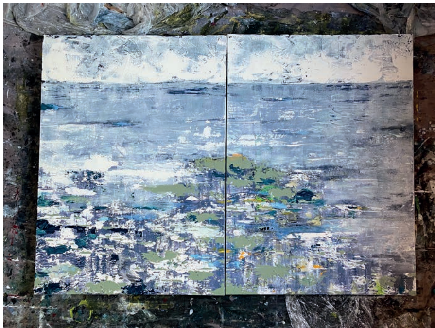
Llenç d' Enemigo del pueblo . Tècnica mixta sobre llenç. Francisco Coll

menos necesidad tengo de escribir, dado que la excitación general que uno necesita para componer desaparece. Pero al final escribo todos los días del año, al tratarse de una necesidad oriunda e inevitable. No estoy seguro de poder responder a tu observación. Supongo que el contraste entre mi persona y mi música es algo normal. Yo no soy el mismo cuando compongo –me siento más como un animal salvaje–, que cuando salgo a la calle –que inmediatamente me domestico–. Pero es que tampoco soy el mismo hablando aquí contigo en el sofá que subido a un escenario para dirigir, o haciendo el amor con mi mujer. Supongo que cada situación requiere de una actitud y un talante diferente. A nivel personal, mi objetivo es llegar a ser un compositor anónimo y componer en la sombra.